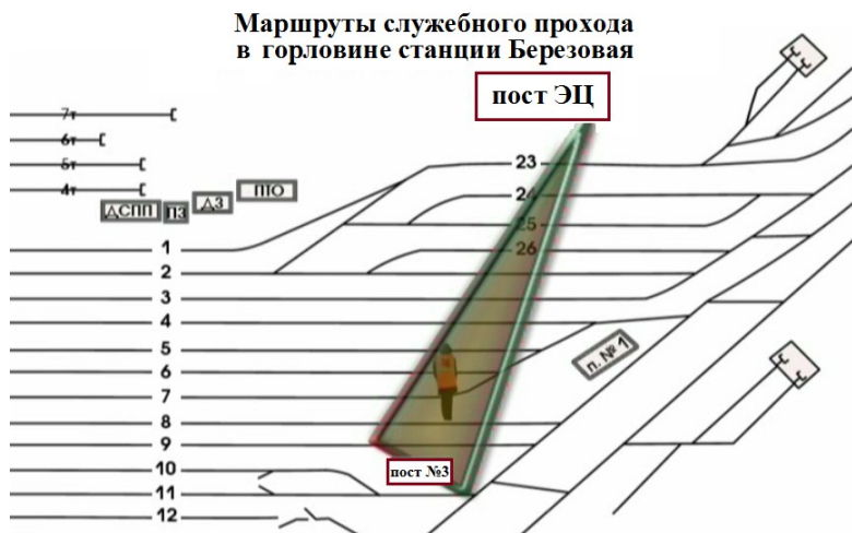
Рис.3 Визуальный контроль во время работы маневрового диспетчера