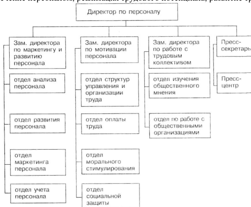
Рис. 1. Схема организационной структуры дирекции по персоналу

Служба управления персоналом комбината осуществляет свою деятельность по трем основным направлениям: обеспечение персоналом; реализация трудового потенциала; развитие трудового потенциала.