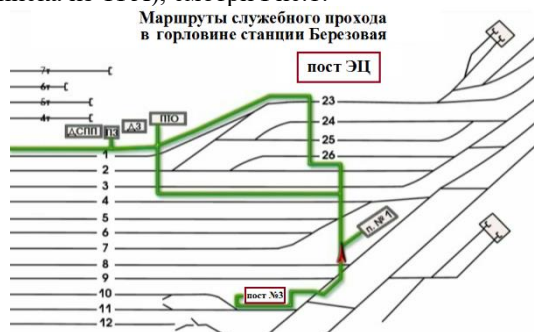
Рис.1 Маршруты служебного прохода для передвижения работников в южной горловине станции

Передвижение работников ж.д. транспорта по станции Березовая в южной горловине, должно осуществляется согласно маршрутам служебного прохода (выписка из ТРА), смотри Рис.1.