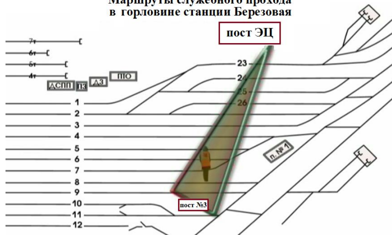
Рис.3 Визуальный контроль во время работы маневрового диспетчера

После закрепления тормозными башмаками поезда №3003 по 5С пути, вернувшись на пост №3, сигналистом об этом было доложено ДСП.