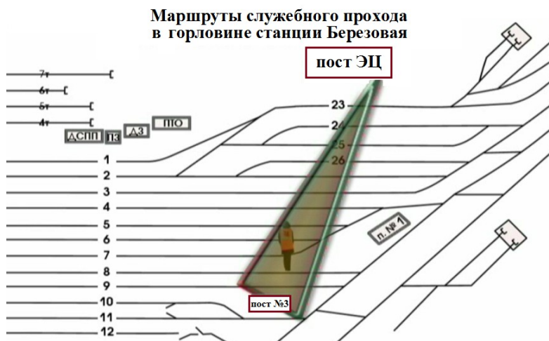
Рис.3 Визуальный контроль во время работы маневрового диспетчера