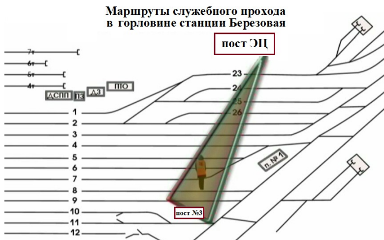
Рис.3 Визуальный контроль во время работы маневрового диспетчера