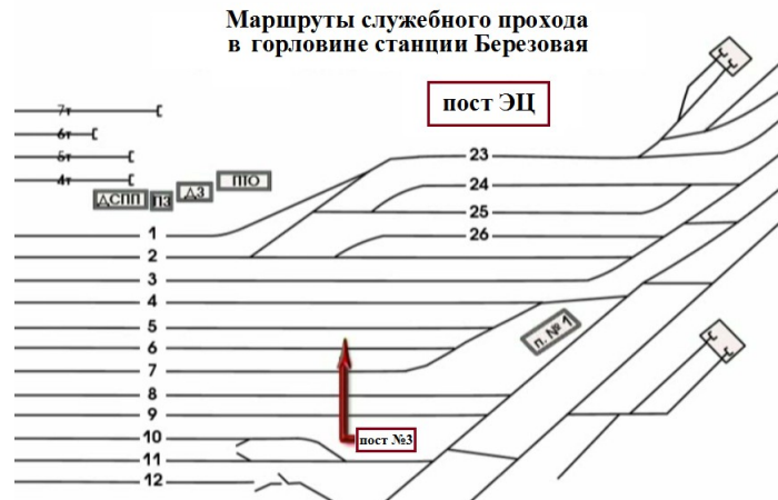
Рис.2 Маршрут передвижения сигналиста Виноградовой А.П. в южной горловине станции

Сигналист, в виду свободы путей от подвижного состава по 7С, 8С и 9С пути, устремилась к стоящему по 5С пути поезду №3003 по кратчайшему пути, игнорируя служебные проходы, смотри Рис.2 (нарушение условий передвижения по ж.д. путям работника станции к месту работ). Произвела закрепление поезда №3003 с юга двумя тормозными башмаками №345 и №344, после чего, устремилась обратным путем к посту №3 (повторное нарушение условий передвижения по ж.д. путям работника станции).