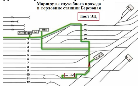
Рис.1 Маршруты служебного прохода для передвижения работников в южной горловине станции

мысли были о простывшем ребенке. Работа по станции продолжалась, производилась маневровая работа с поездом №3001 по 6С пути, с последующей вытяжкой его на сортировочную горку. Передвижение работников ж.д. транспорта по станции Березовая в южной горловине, должно осуществляться согласно маршрутам служебного прохода (выписка из ТРА), смотри Рис.1.