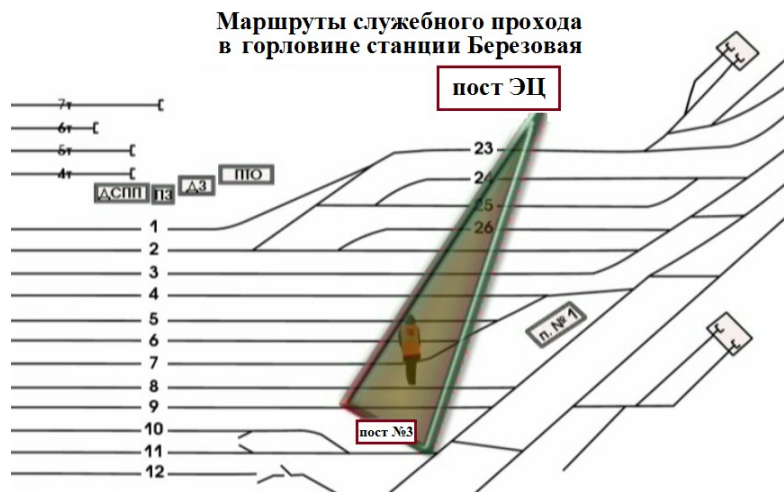
Рис.3 Визуальный контроль во время работы маневрового диспетчера

После закрепления тормозными башмаками поезда №3003 по 5С пути, вернувшись на пост №3, сигналистом об этом было доложено ДСП.