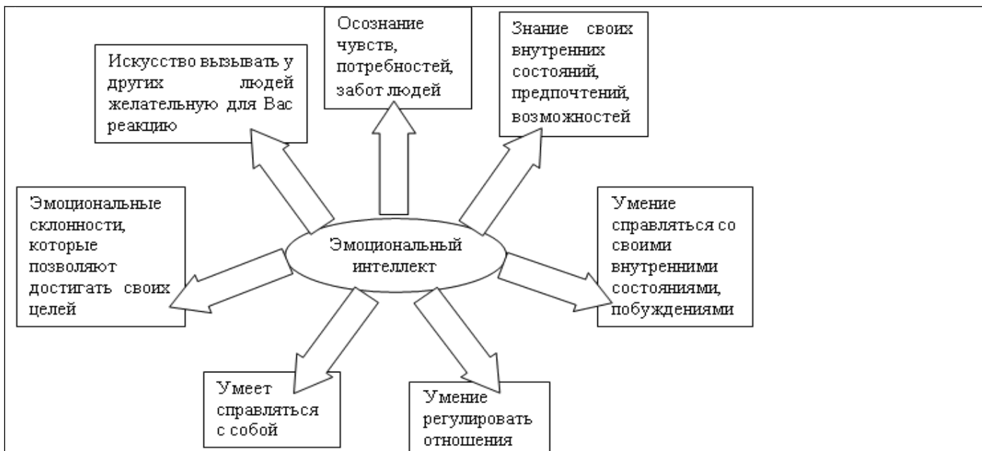
Рис. 1 Структура эмоциональной компетентности

На рисунке.1. представлено содержание эмоциональной компетентности (Д. Гоулман). Заполнить пустые элементы данного рисунка (стрелки), написав название 7-ми компетенций.