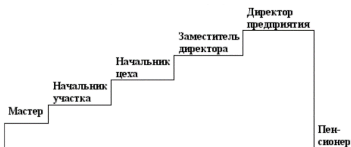
Модель карьеры D