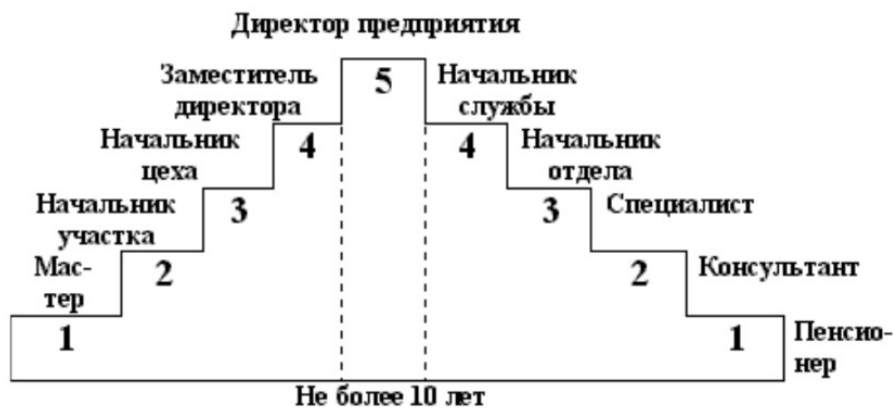
Модель карьеры В