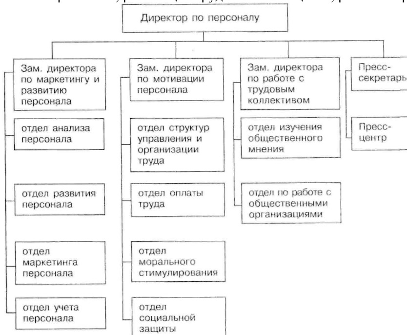
Рис. 4.1. Схема организационной структуры дирекции по персоналу

Служба управления персоналом комбината осуществляет свою деятельность по трем основным направлениям: обеспечение персоналом; реализация трудового потенциала; развитие трудового потенциала.