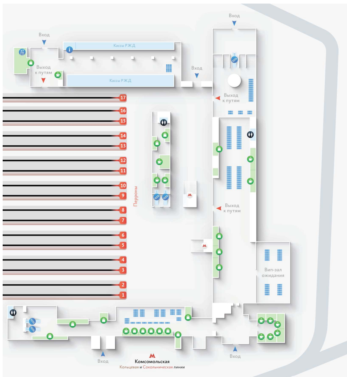
Рисунок 1.1 – Схема Казанского вокзала

Для заданного вокзального комплекса разрабатывается ряд мероприятий и выбирается маршрут беспрепятственного следования маломобильного пассажира согласно СТО РЖД 03.001-2014.