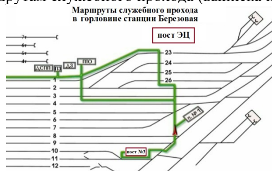
Рис.1 Маршруты служебного прохода для передвижения работников в южной горловине станции

Передвижение работников ж.д. транспорта по станции Березовая в южной горловине, должно осуществляется согласно маршрутам служебного прохода (выписка из ТРА), смотри Рис.1.